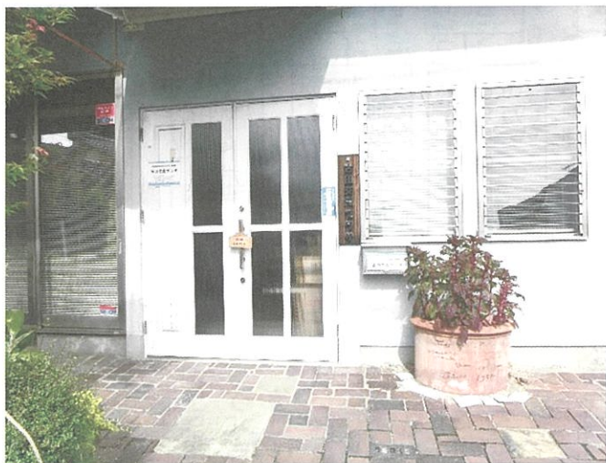
古田交流プラザ 郵便局の向かい側です