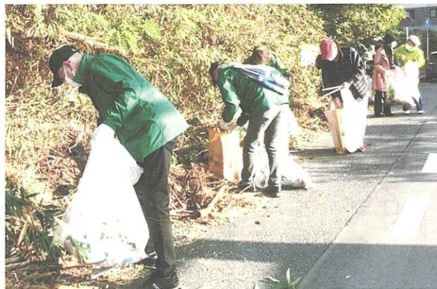
走行車両に気を配りながらのごみ拾い

11月20日(土)9時、古江2号トンネル北側階段付近に集合し古江2号トンネルを起点に東西側道の清掃を行いました。約1時間の清掃活動でしたが、草むらの中から空き缶、ペットボトル、空ビン、運動靴、ホイール、壺、割れた鏡などが出てきました。集合場所でごみの分別をして解散となりました。