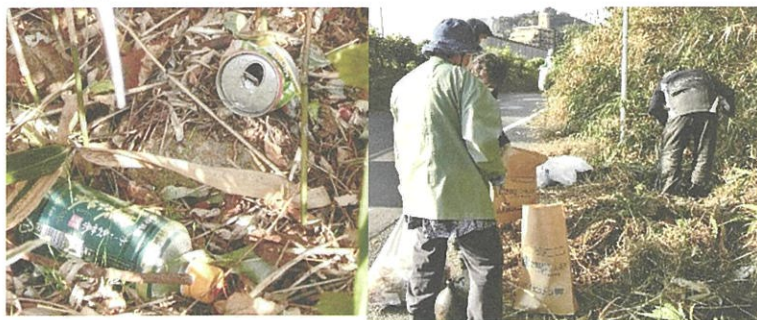
草むらに隠れている散乱ごみを探し出す

古田学区公衆衛生協議会が、地域の美化にかかわる自主的な取り組みとして実施しました。